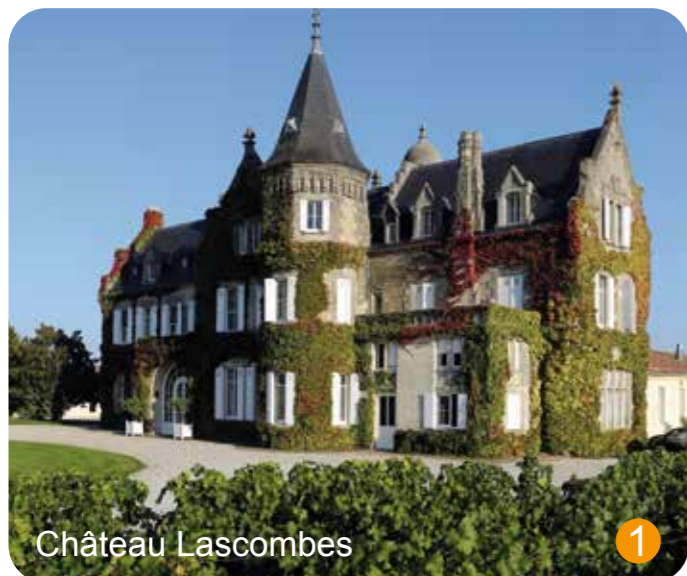
Château Lascombes 1

Et retrouvez ce circuit sur votre mobile avec Google Maps