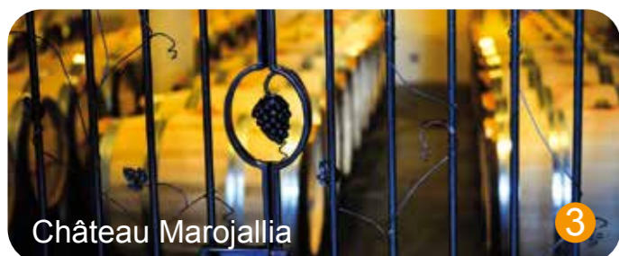
Château Marojallia 3