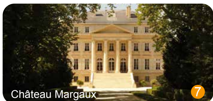
Château Margaux 7