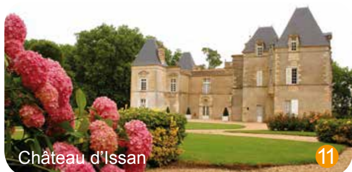
Château d'Issan 11

Point de départ : parking, place La Trémoille à Margaux (en face de la Maison du Vin et du Tourisme)