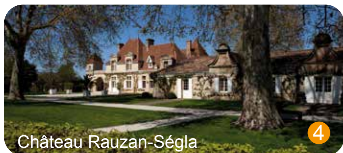
Château Rauzan-Ségla 4